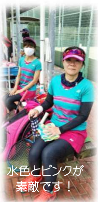
水色とピンクが素敵です!

延岡市、宮崎市に次いで、皆様からご協力をいただいている生理用品を日南市に寄付いたしました。日南市では、定期的、必要なご家庭にお届けしているそうです。継続的な支援が求められている物なので、大変有難いと感謝の言葉をいただきました。大会で設置しているBOXもお馴染みとなり、たくさんの方にご協力をいただき、感謝しております。