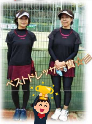
ベストプレイヤー賞 これはもしや!? ヨネックスのY!? このお二人は、いつも賑わせてくれます(*_*)