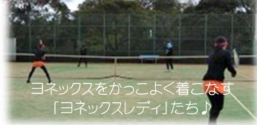
ヨネックスをカッコよく着こなす「ヨネックスレディ」たち♪