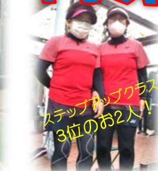
ステップアップクラス 3位のお2人!!