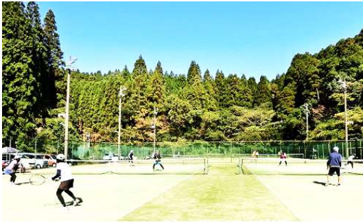
*ファイナルテニスクラブ*