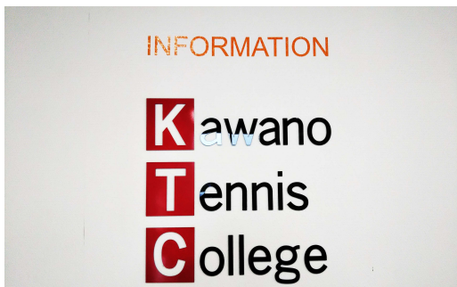
* インスタでおなじみ！入賞者の背景ロゴ！ *

KTC(カワノテニスカレッジ)は、三股町にあるテニススクールです。レッスンはわかりやすく丁寧な指導！インドアコートで雨の日でも安心！女性の敵の紫外線も防げます！