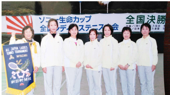
* 2010年、クラブより3名出場 *

故松井コーチの名をとってヒロレディースが結成されたのが2002年頃、あれから20年、皆60代となりました。全員が生涯テニスを目指し、きっと20年後もラケットを振り回していることでしょう。