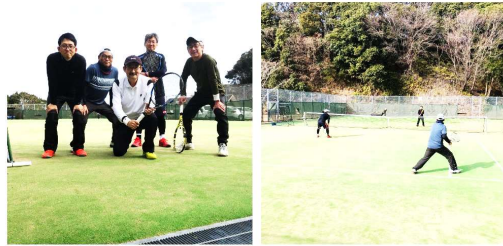
*練習中の一コマ。ちょっとおすまして。*