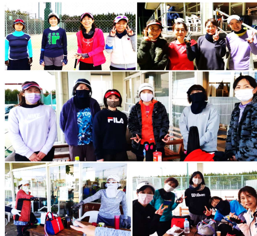
* とある一週間の朝～夜までの切り抜き *